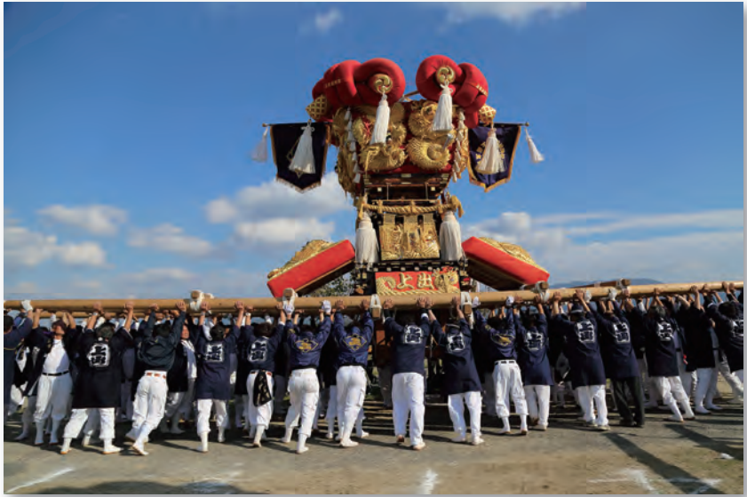
柞田秋祭り (日枝神社)