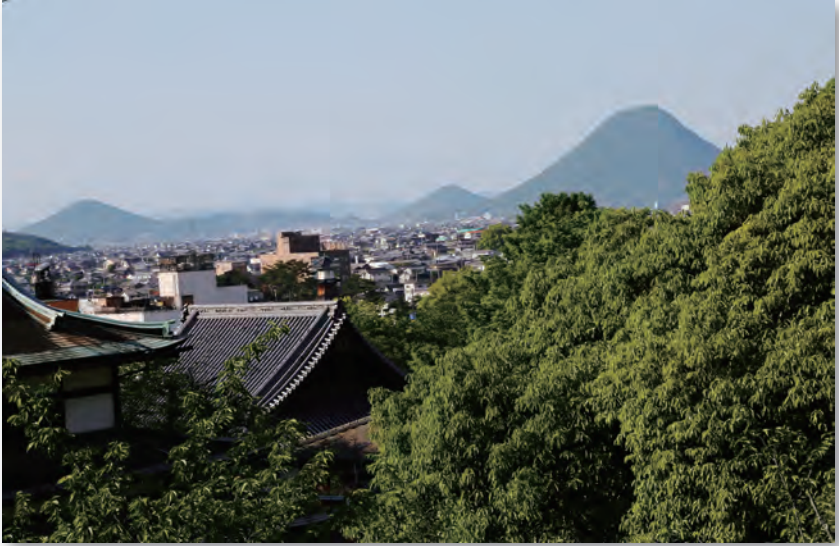
大門からの眺望（金毘羅さん）