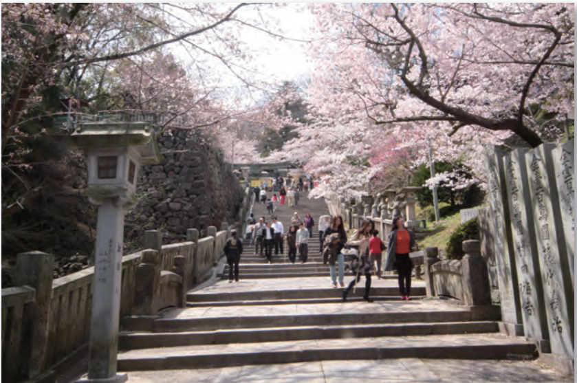
桜の参道（金毘羅さん）