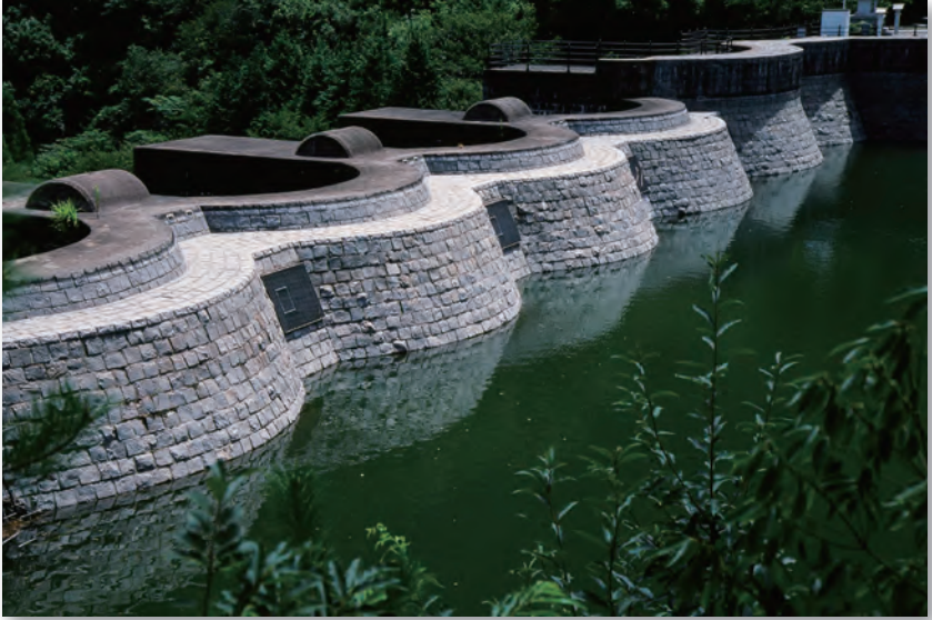
豊稔池石積アーチダム (大野原町)