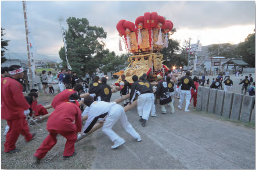
五十鈴神社秋祭り(豊中)