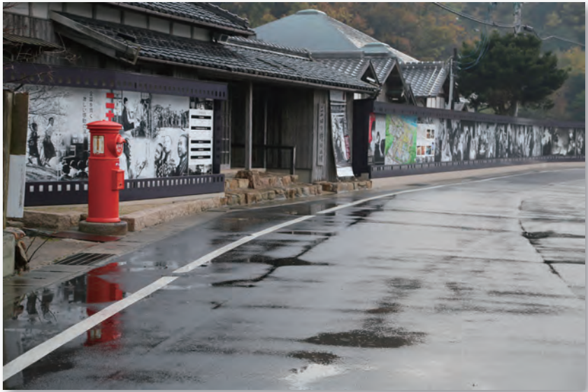
「二十四の瞳」映画村 (小豆島)