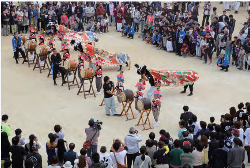
木之郷地区の獅子舞い (柞田小学校)