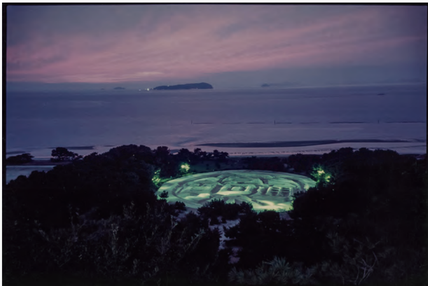
琴弾公園の銭形砂絵「寛永通宝」