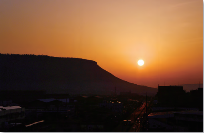
屋島の夜明け（高松市）