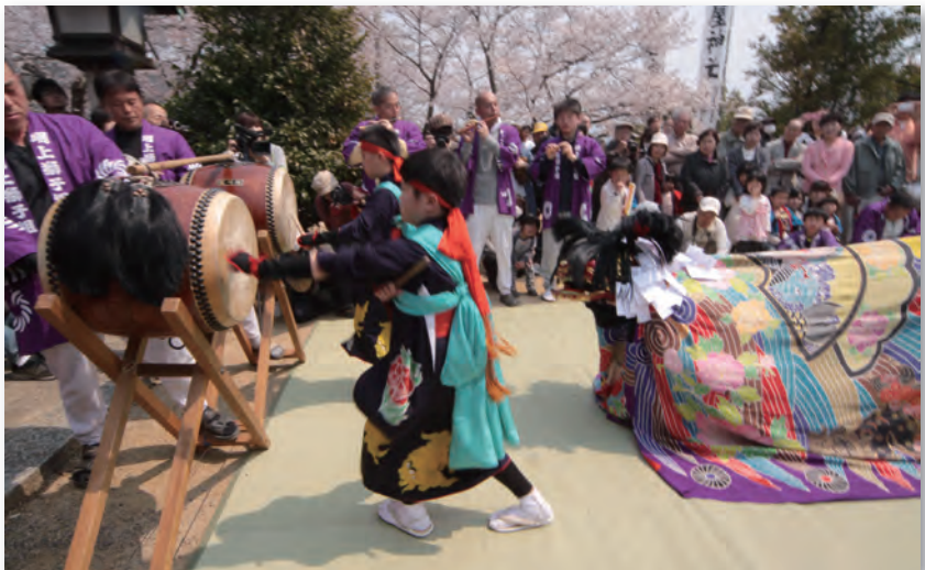
高屋神社「獅子舞い奉納」（高屋まつり）