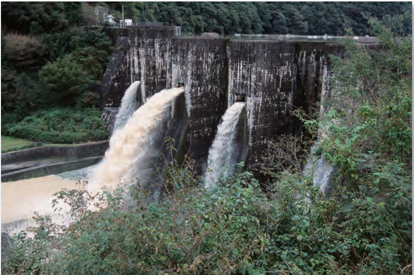
豊稔池ゆる抜き (大野原町)