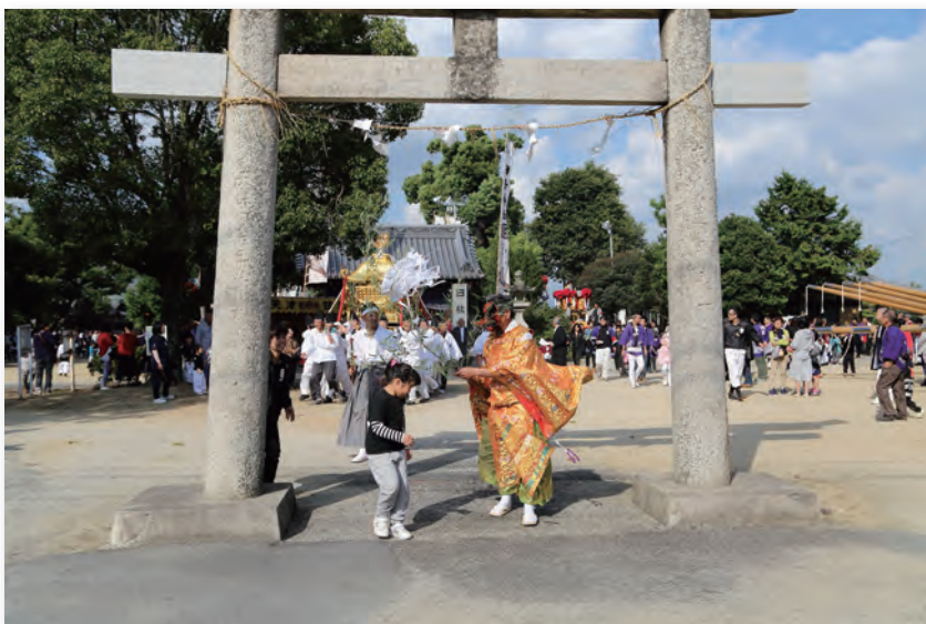
日枝神社 (柞田町・山王)