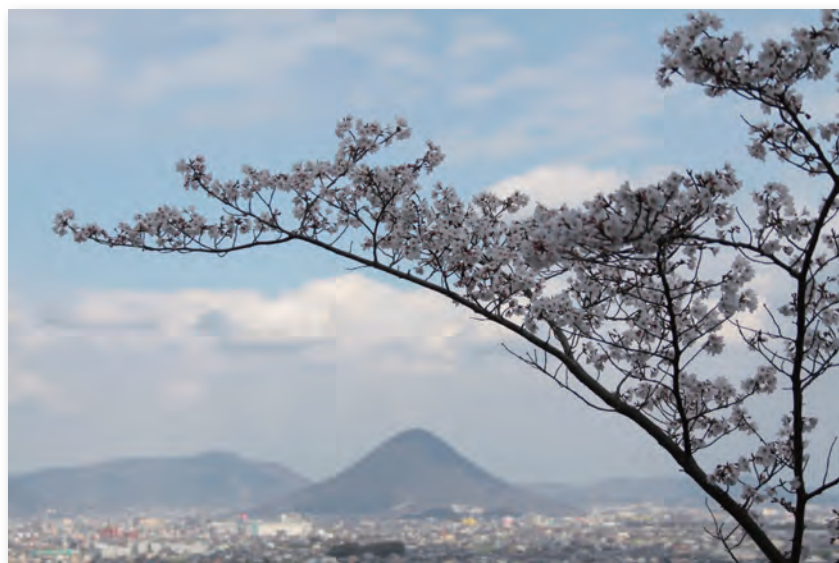
飯野山「讃岐富士」(桃陵公園から)