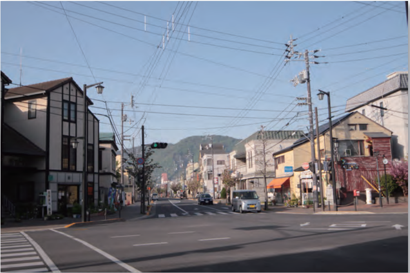
上市コミュニティセンター通り