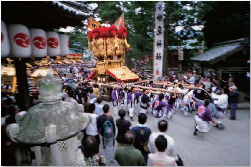
豊浜ちょうさまつり (豊浜八幡神社)