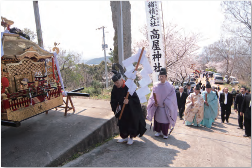
高屋神社（高屋まつり）