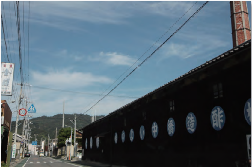
仁尾酢付近 (仁尾町)