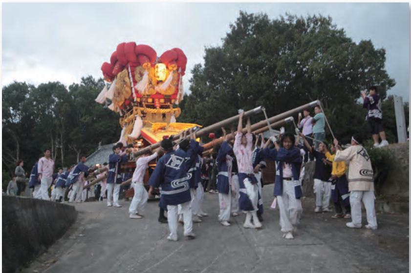
五十鈴神社秋祭り(豊中)