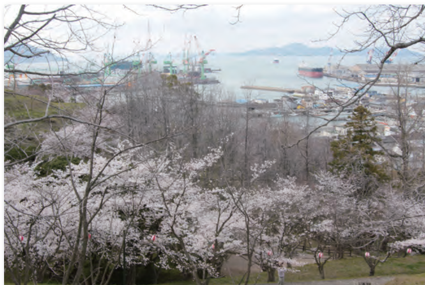
桃陵公園 (多度津町)