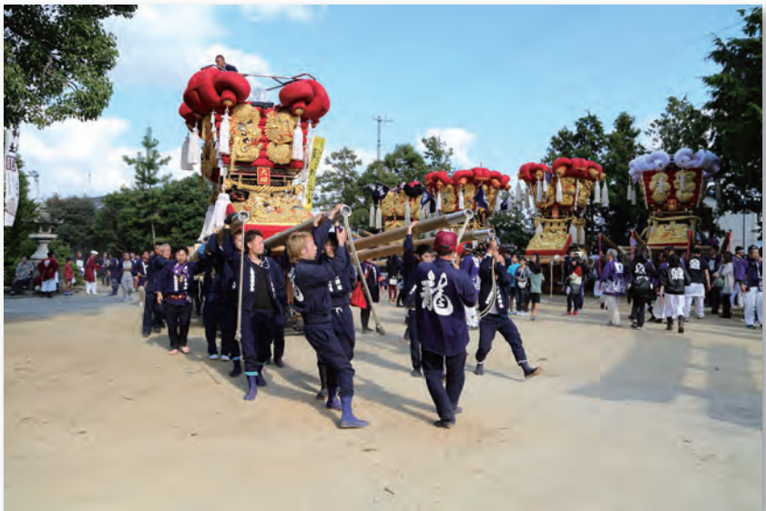
柞田秋祭り (日枝神社)