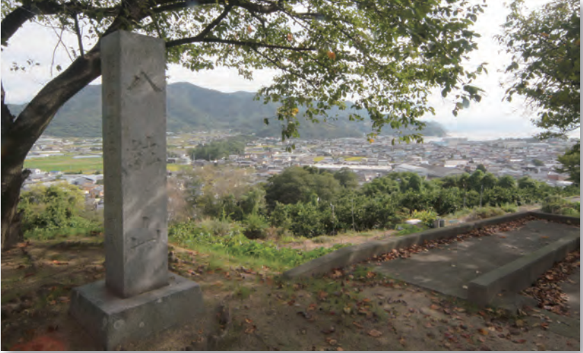
八紘山公園（仁尾町）