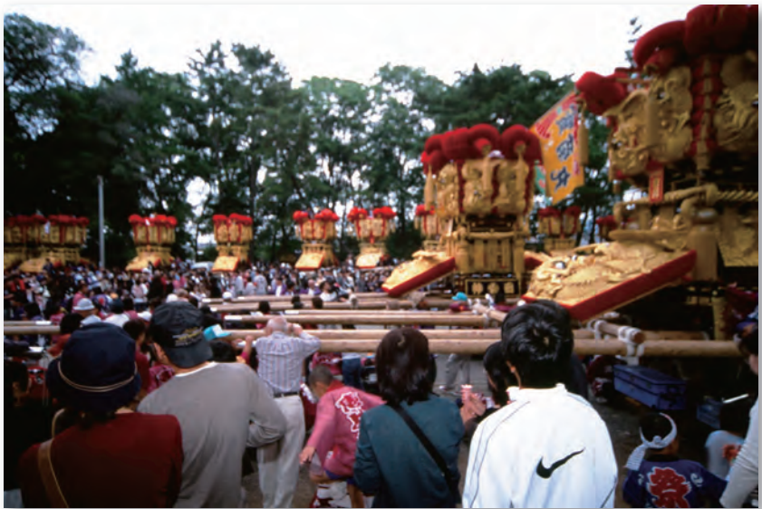
豊浜ちょうさまつり (豊浜八幡神社)