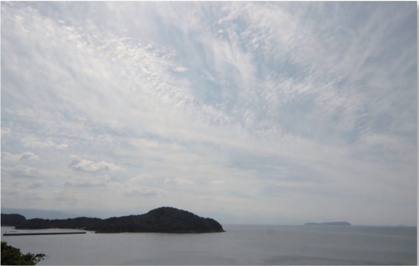
蔦島と伊吹島（仁尾町）